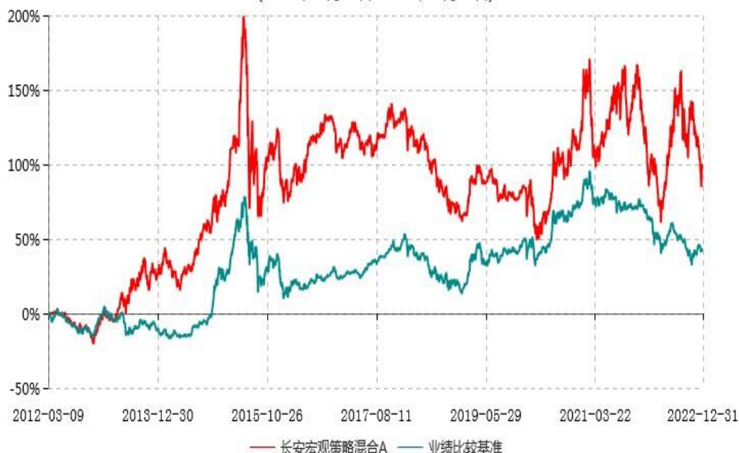
长安宏观策略混合A累计净值增长率与业绩比较基准收益率历史走势对比图 (2012年03月09日-2022年12月31日)

根据基金合同的规定,自基金合同生效之日起 6 个月内基金各项资产配置比例需符合基金合同要求。本基金在建仓期结束后,各项资产配置比例已符合基金合同有关投资比例的约定。基金合同生效日至报告期期末,本基金运作时间超过一年。图示日期为 2012 年 03 月 09 日至 2022 年 12 月 31 日。