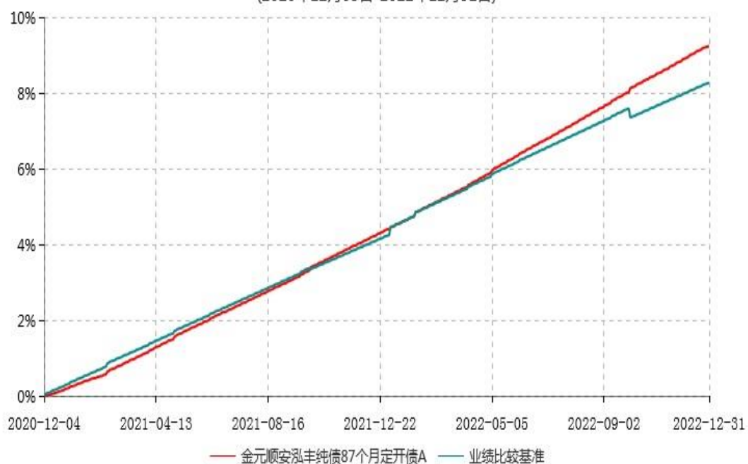
金元顺安泓丰纯债87个月定开债A累计净值增长率与业绩比较基准收益率历史走势对比图 (2020年12月03日-2022年12月31日)