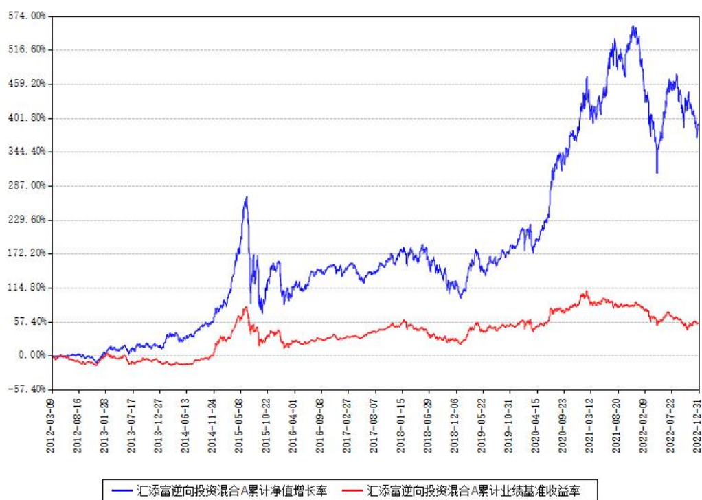
汇添富逆向投资混合A累计净值增长率与同期业绩比较基准收益率对比图