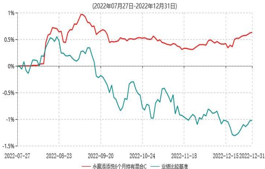
永赢添添悦6个月持有混合C累计净值增长率与业绩比较基准收益率历史走势对比图

注：1、本基金合同生效日为2022年7月27日，截至本报告期末本基金合同生效未满一年； 2、本基金建仓期为本基金合同生效日起六个月，截至本报告期末，本基金尚处于建仓期中。