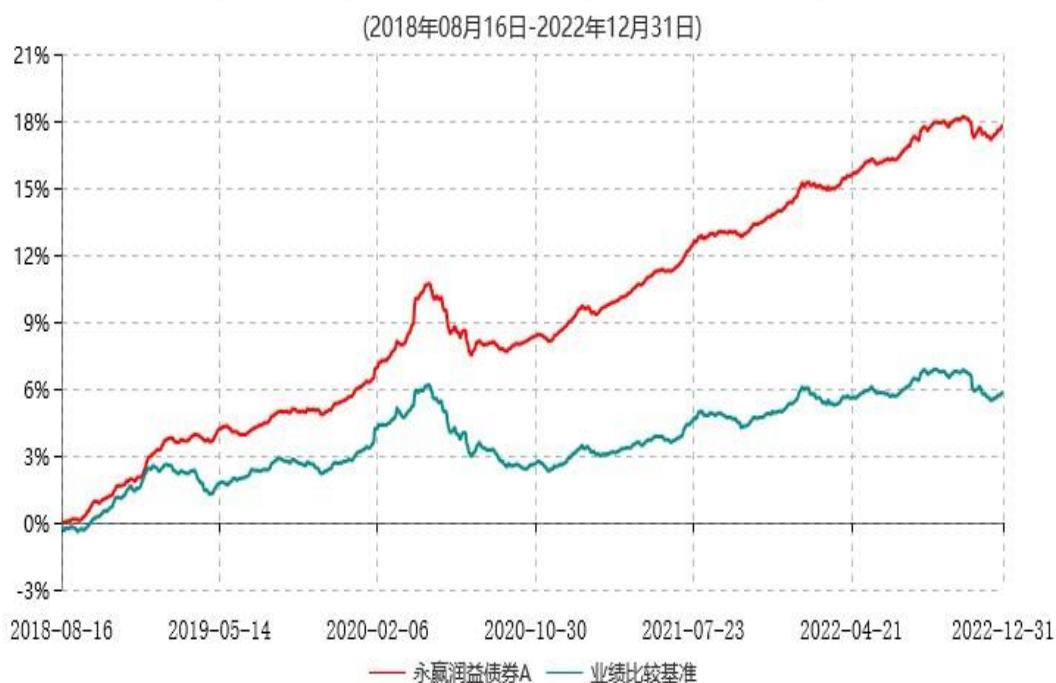
永赢润益债券A累计净值增长率与业绩比较基准收益率历史走势对比图