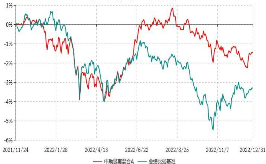
中融景惠混合C累计净值增长率与业绩比较基准收益率历史走势对比图