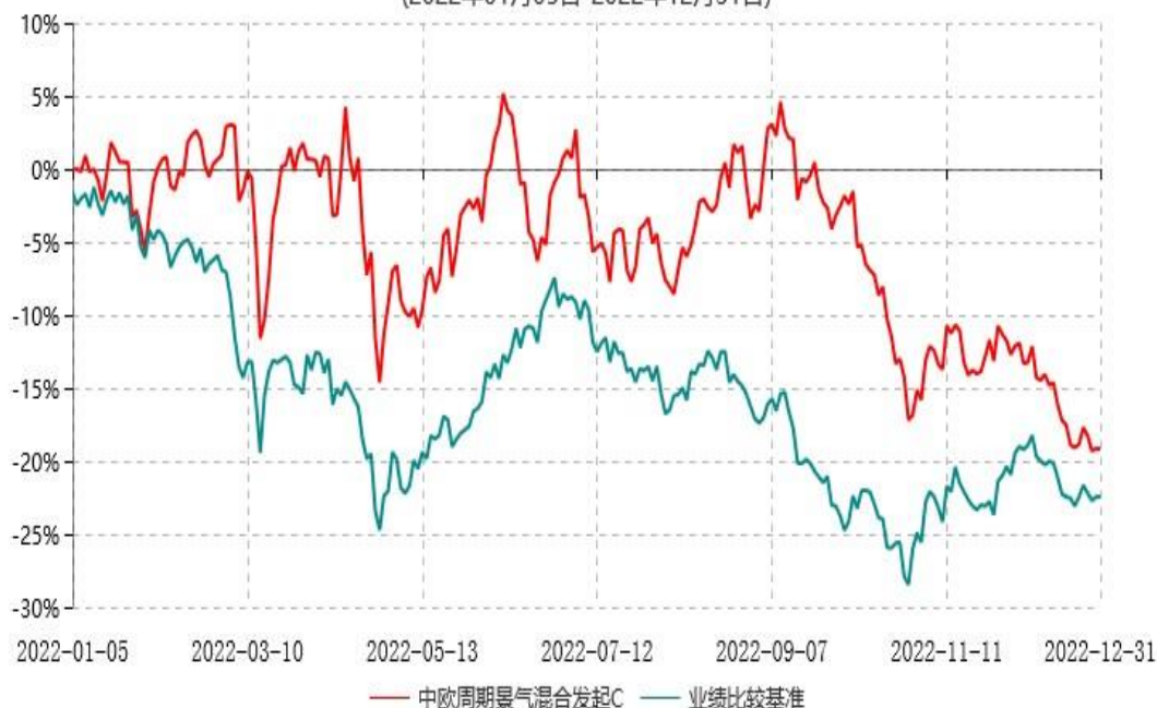
中欧周期景气混合发起C累计净值增长率与业绩比较基准收益率历史走势对比图 (2022年01月05日-2022年12月31日)

注：本基金基金合同生效日期为 2022 年 1 月 5 日，自基金合同生效日起到本报告期末不满一年，按基金合同的规定，本基金自基金合同生效起六个月为建仓期，建仓期结束时各项资产配置比例已符合基金合同约定。