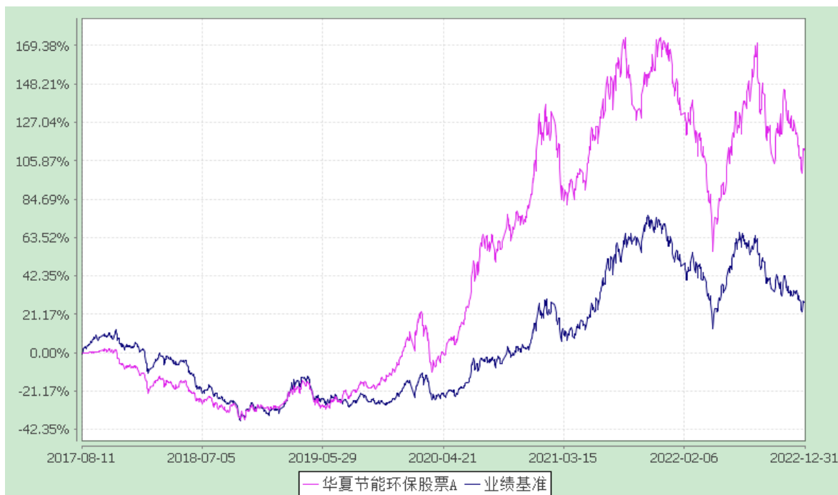
华夏节能环保股票 C: