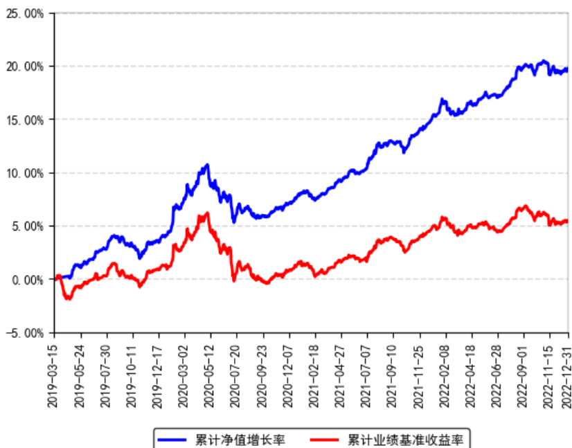
南方中债 7-10 年国开行债券指数 A 累计净值增长率与同期业绩比较基准收益率的历史走势对比图