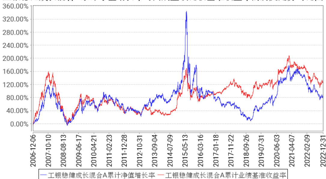
工银稳健成长混合A累计净值增长率与同期业绩比较基准收益率的历史走势对比图