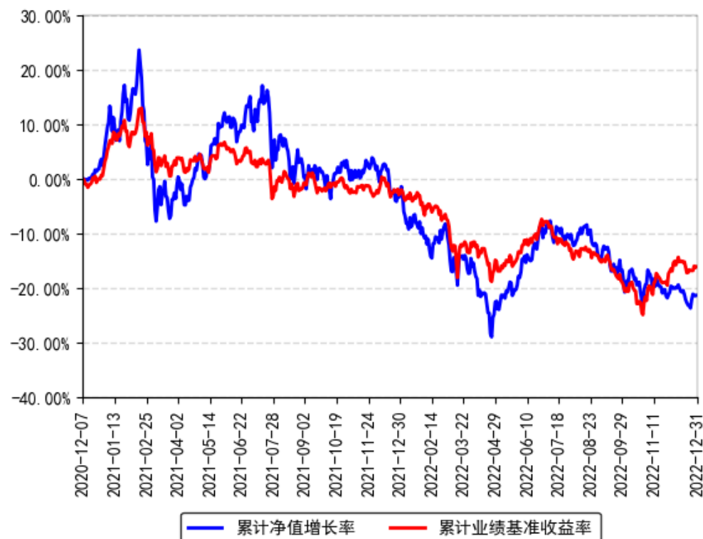
南方产业升级混合A累计净值增长率与同期业绩比较基准收益率的历史走势对比图