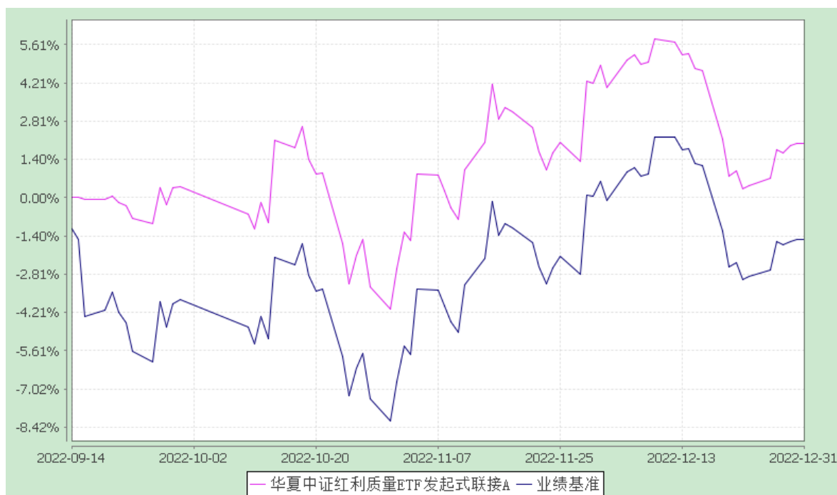
华夏中证红利质量 ETF 发起式联接 C: