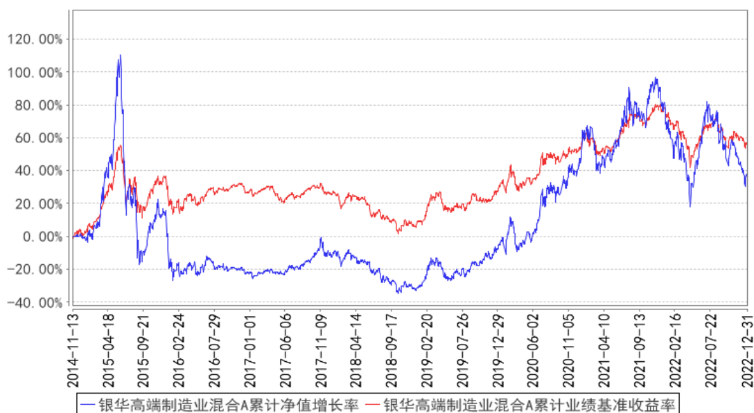
银华高端制造业混合A累计净值增长率与同期业绩比较基准收益率的历史走势对比图