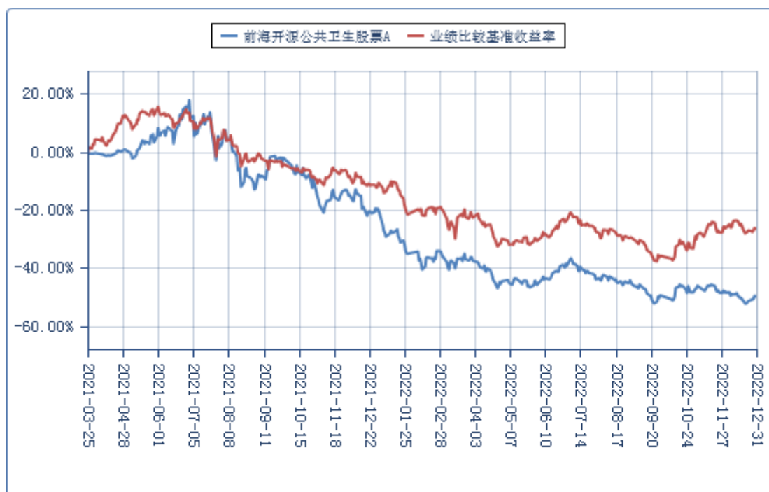
前海开源公共卫生股票 C