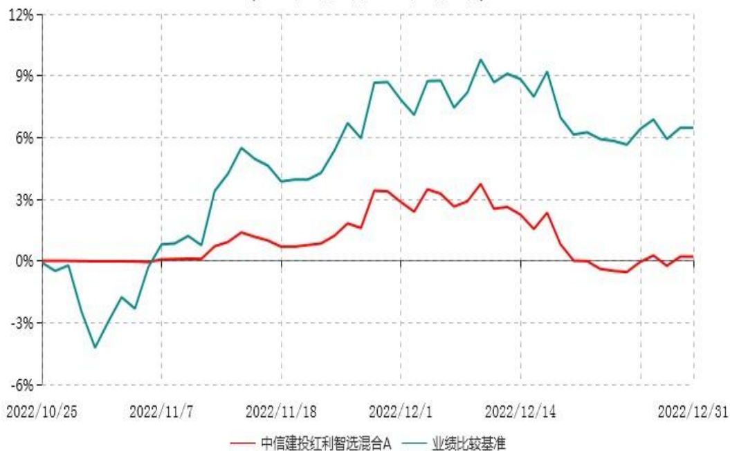
中信建投红利智选混合A累计净值增长率与业绩比较基准收益率历史走势对比图 (2022年10月25日-2022年12月31日)