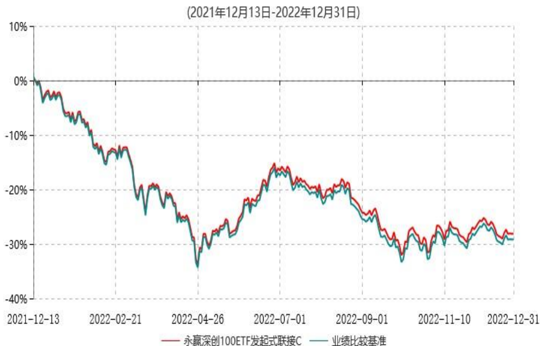
永赢深创100ETF发起式联接C累计净值增长率与业绩比较基准收益率历史走势对比图