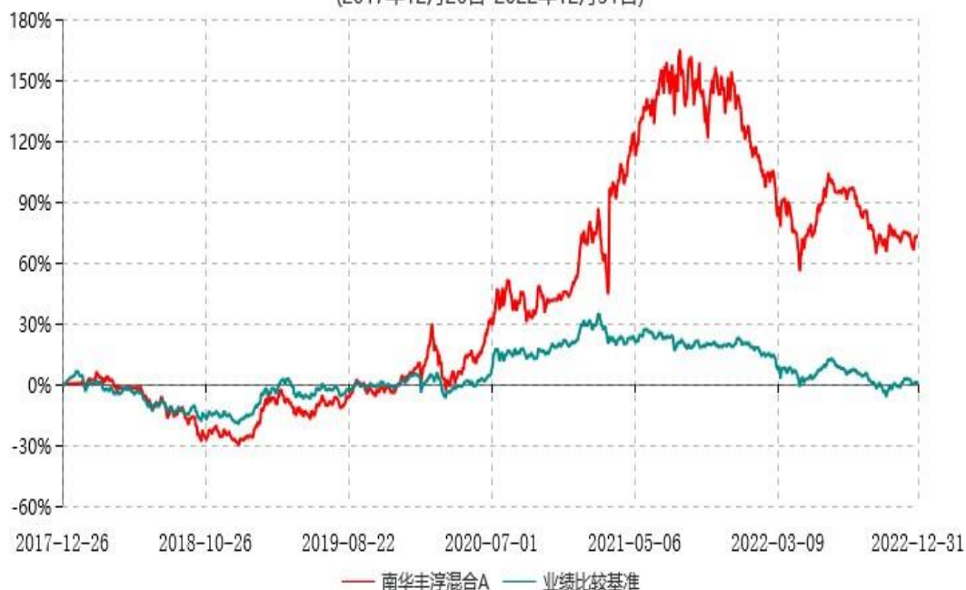
南华丰淳混合C累计净值增长率与业绩比较基准收益率历史走势对比图