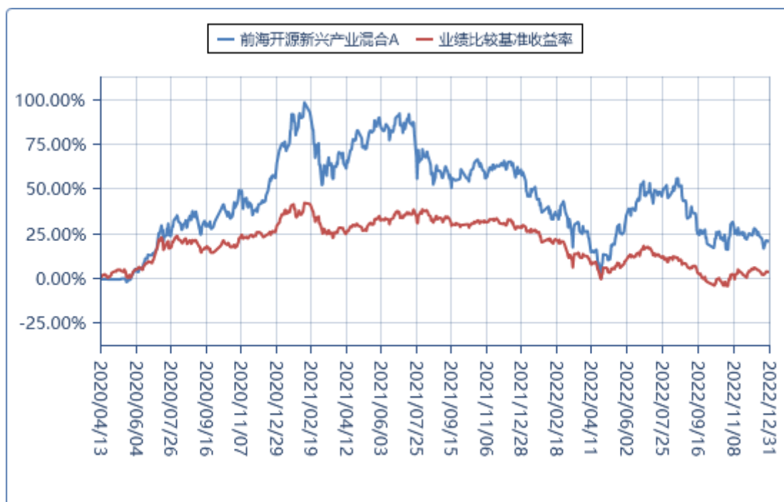
前海开源新兴产业混合 C