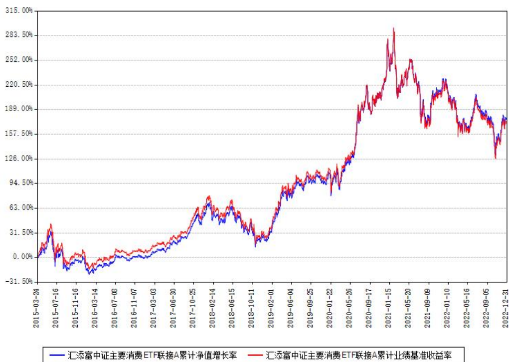
汇添富中证主要消费ETF联接A累计净值增长率与同期业绩基准收益率对比图