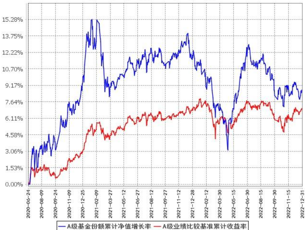
A级基金份额累计净值增长率与同期业绩比较基准收益率的历史走势对比图 (2020年6月24日至2022年12月31日)