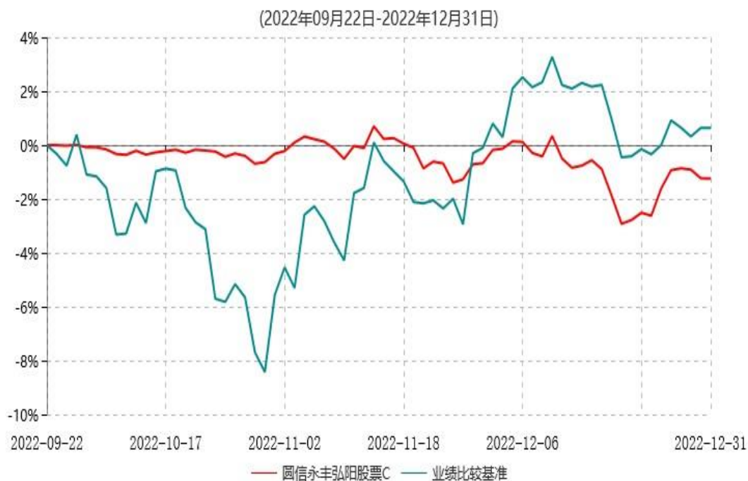
圆信永丰弘阳股票C累计净值增长率与业绩比较基准收益率历史走势对比图