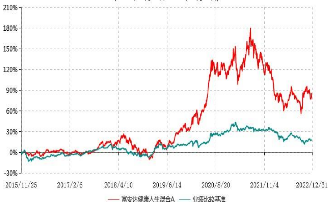
富安达健康人生混合A累计净值增长率与业绩比较基准收益率历史走势对比图 (2015年11月25日-2022年12月31日)