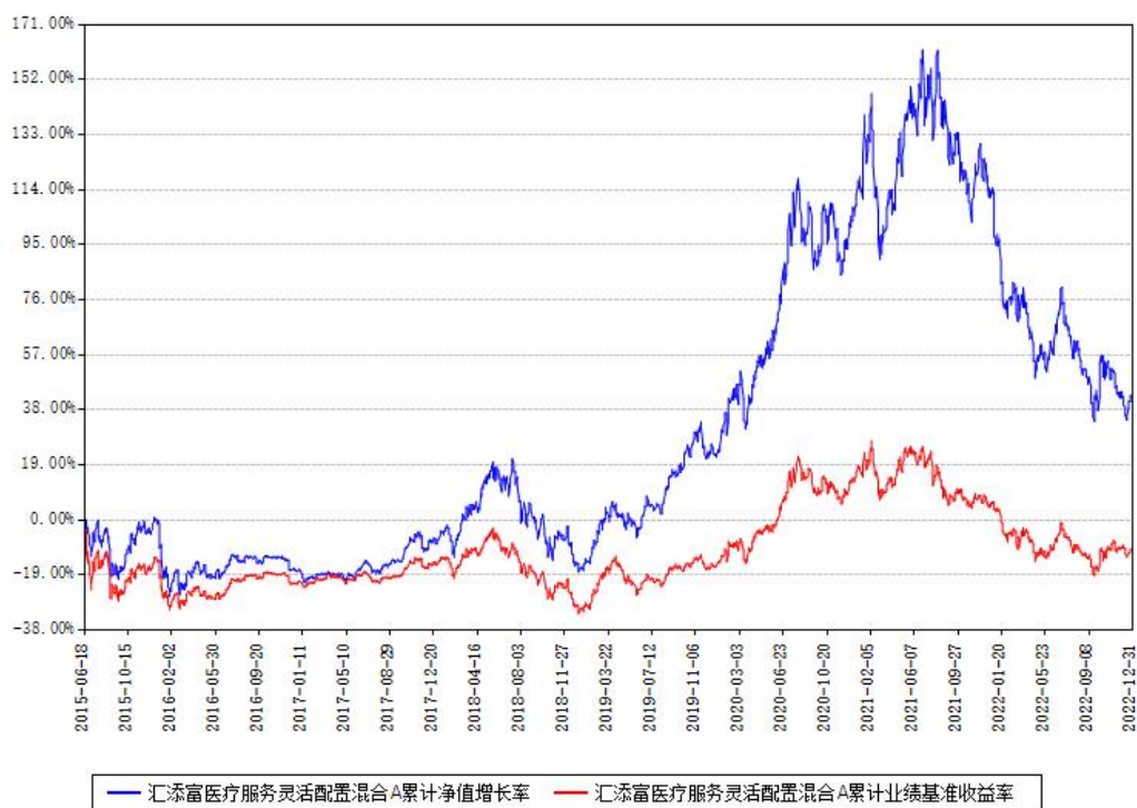
汇添富医疗服务灵活配置混合A累计净值增长率与同期业绩比较基准收益率对比图