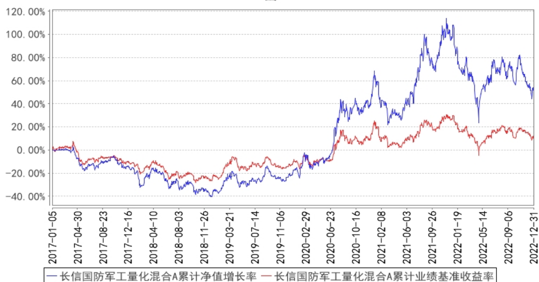
长信国防军工量化混合A累计净值增长率与同期业绩比较基准收益率的历史走势对比图