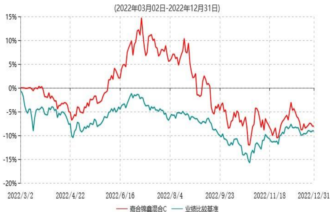
嘉合锦鑫混合C累计净值增长率与业绩比较基准收益率历史走势对比图

注：1、本基金合同于 2022 年 03 月 02 日生效，截至本报告期末，本基金合同生效未满一年。