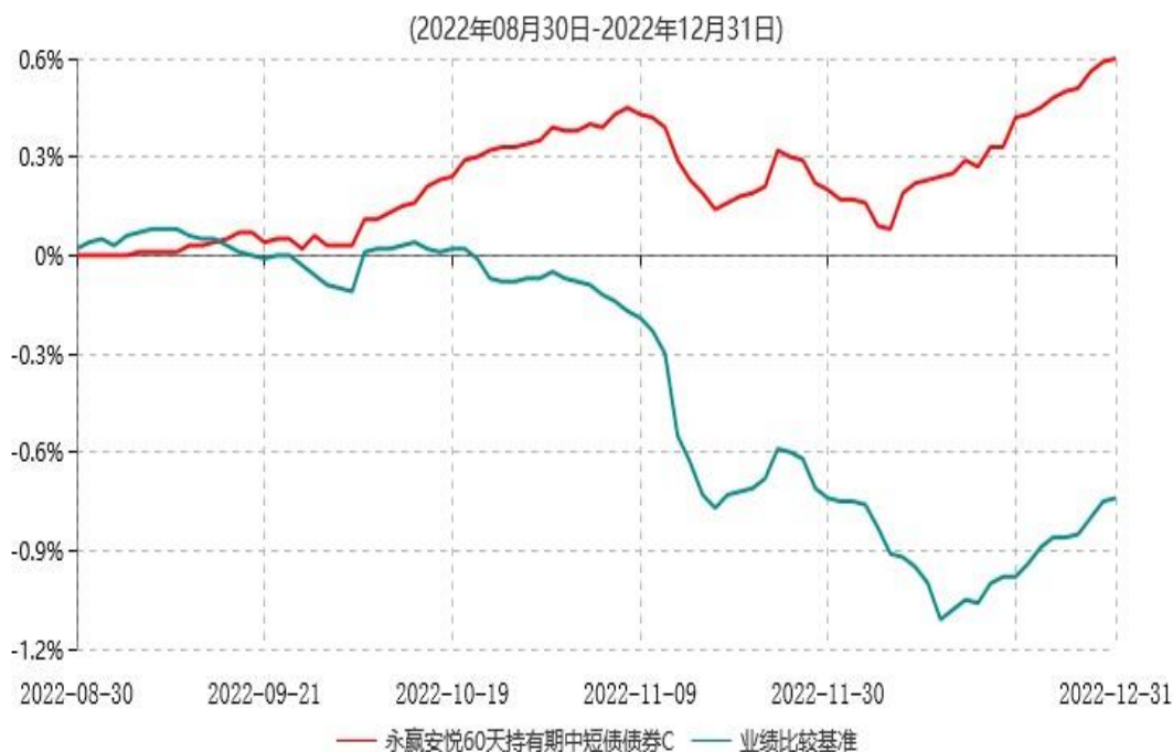
永赢安悦60天持有期中短债债券C累计净值增长率与业绩比较基准收益率历史走势对比图

注：1、本基金合同生效日为2022年8月30日，截至本报告期末本基金合同生效未满一年； 2、本基金建仓期为本基金合同生效日起六个月，截至本报告期末，本基金尚处于建仓期中。