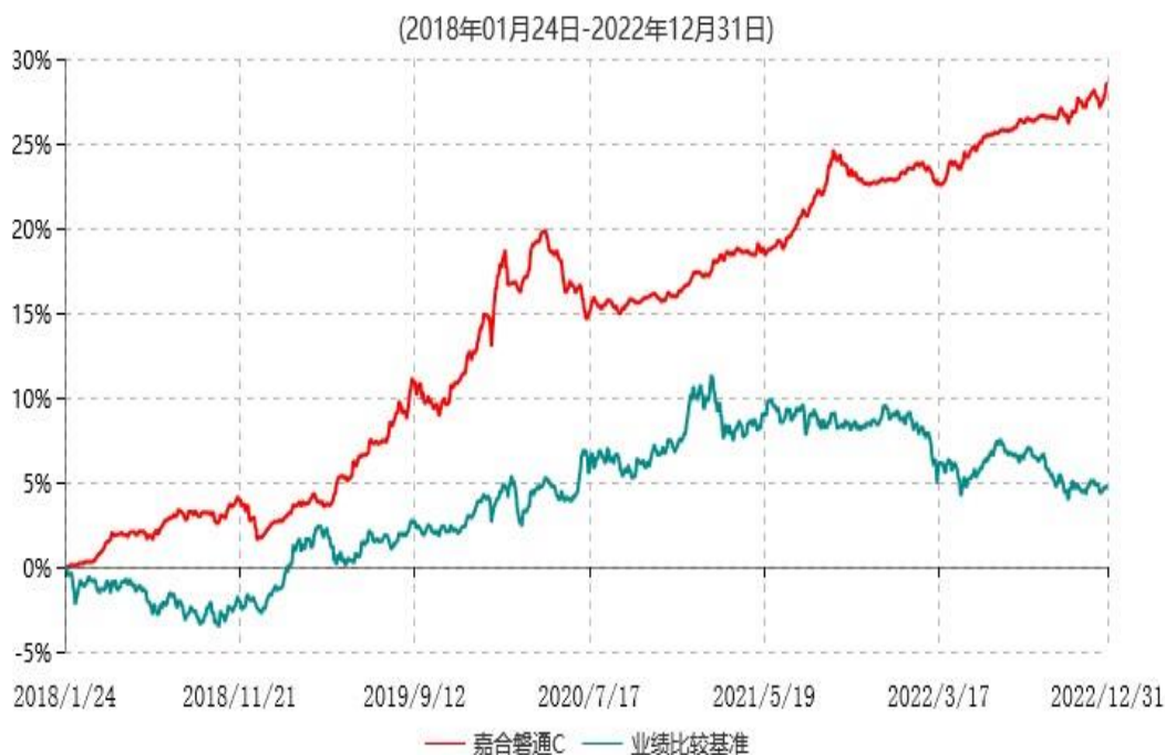
嘉合磐通C累计净值增长率与业绩比较基准收益率历史走势对比图