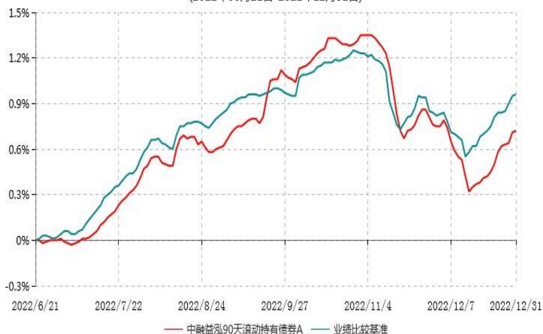
中融益泓90天滚动持有债券A累计净值增长率与业绩比较基准收益率历史走势对比图 (2022年06月21日-2022年12月31日)