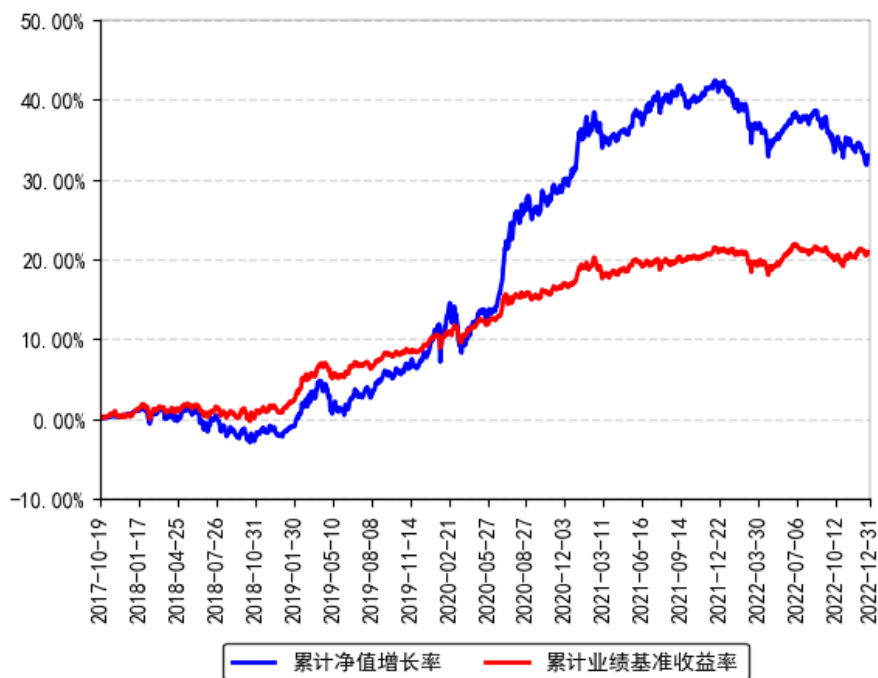
南方全天候策略混合 (FOF) A 累计净值增长率与同期业绩比较基准收益率的历史走势对比图