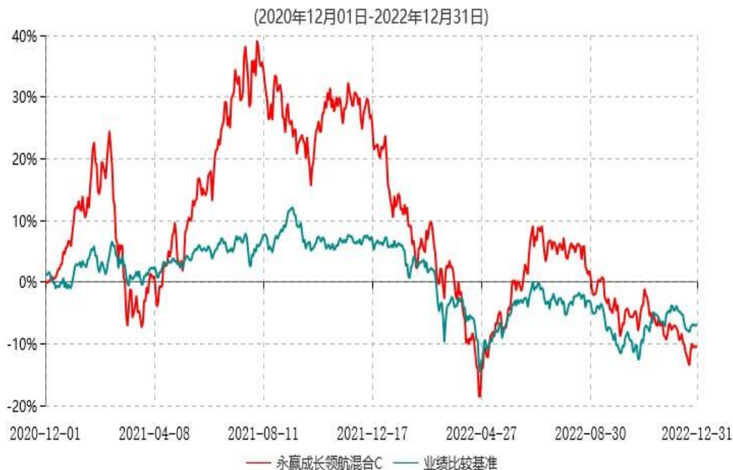
永赢成长领航混合C累计净值增长率与业绩比较基准收益率历史走势对比图