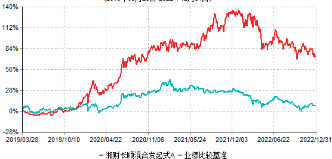
湘财长顺混合发起式A累计净值增长率与业绩比较基准收益率历史走势对比图 (2019年03月28日-2022年12月31日)