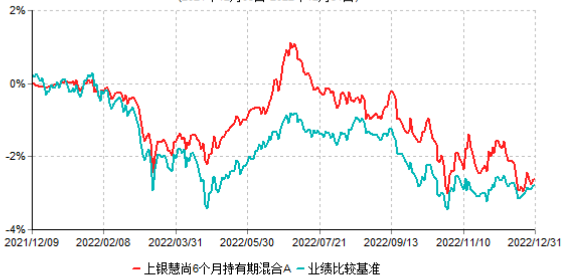
上银慧尚6个月持有期混合A累计净值增长率与业绩比较基准收益率历史走势对比图 (2021年12月09日-2022年12月31日)