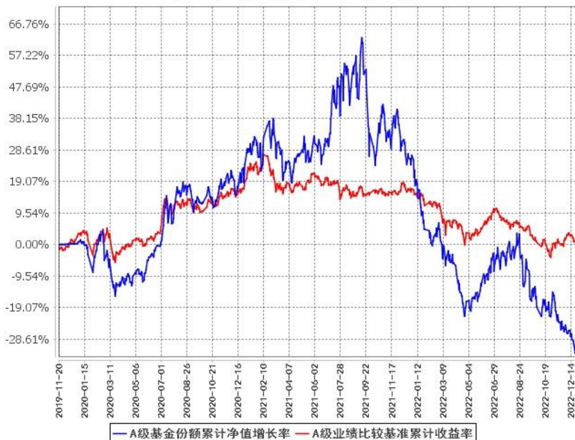
A级基金份额累计净值增长率与同期业绩比较基准收益率的历史走势对比图 (2019年11月20日至2022年12月31日)