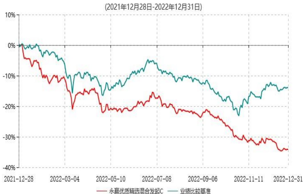
永赢优质精选混合发起C累计净值增长率与业绩比较基准收益率历史走势对比图