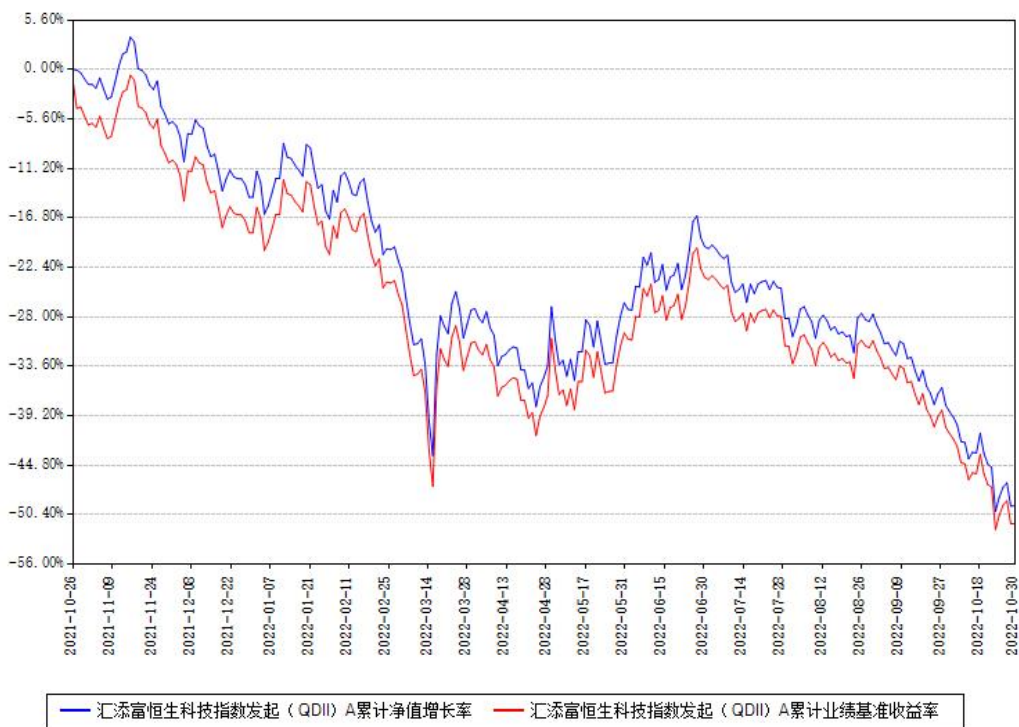
汇添富恒生科技指数发起 (QDII) A 累计净值增长率与同期业绩基准收益率对比图