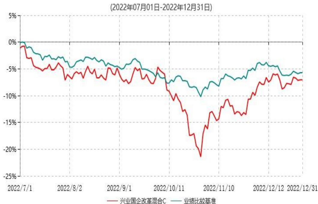
兴业国企改革混合C累计净值增长率与业绩比较基准收益率历史走势对比图

注：1、本基金基金合同于 2015 年 9 月 17 日生效，根据本基金基金合同规定，本基金自基金合同生效之日起六个月内已使基金的投资组合比例符合基金合同的约定。 2、本基金合同自 2015 年 9 月 17 日起生效并增设 C 类份额，自 2022 年 7 月 1 日起 C 类份额存续。