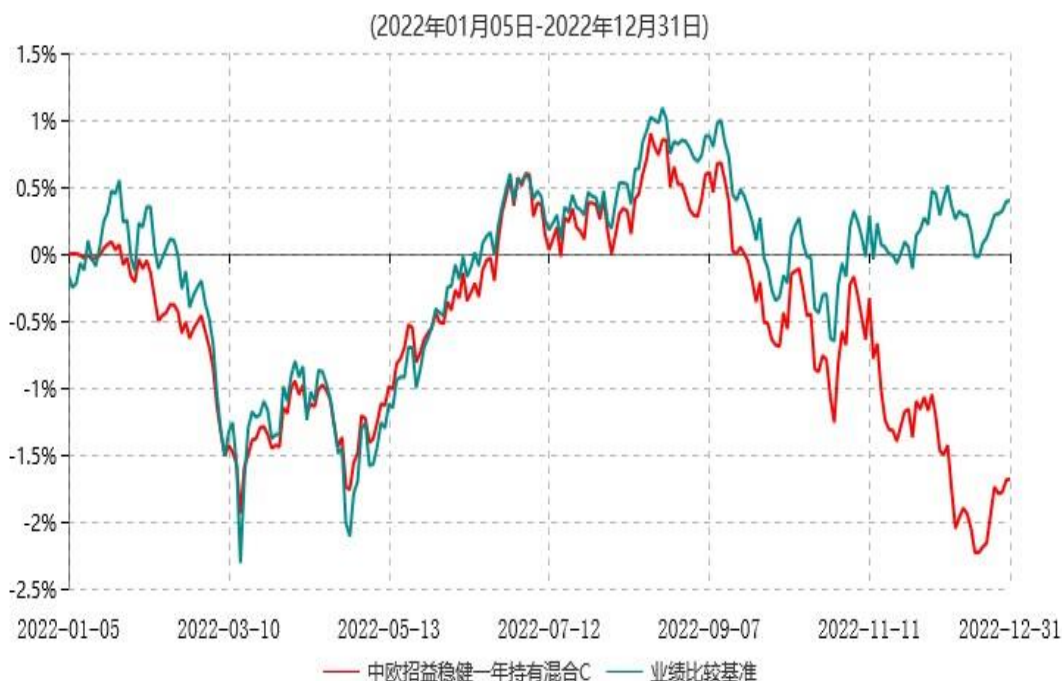
中欧招益稳健一年持有混合C累计净值增长率与业绩比较基准收益率历史走势对比图

注：本基金基金合同生效日期为 2022 年 1 月 5 日，自基金合同生效日起到本报告期末不满一年，按基金合同的规定，本基金自基金合同生效起六个月为建仓期，建仓期结束时各项资产配置比例已符合基金合同约定。