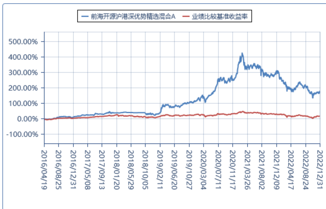
前海开源沪港深优势精选混合 C