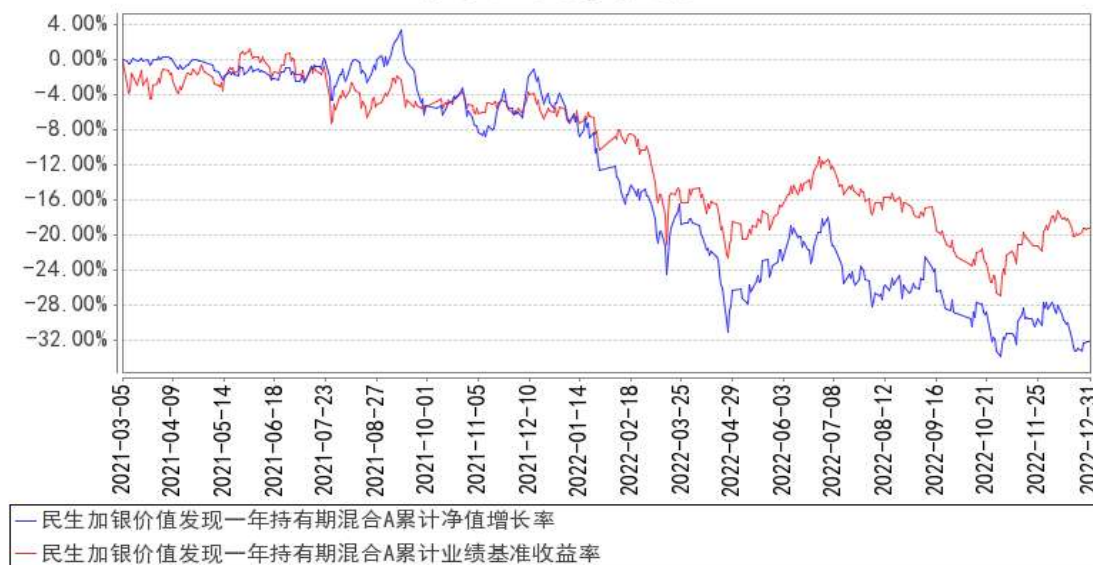
民生加银价值发现一年持有期混合A 累计净值增长率与同期业绩比较基准收益率的历史走势对比图