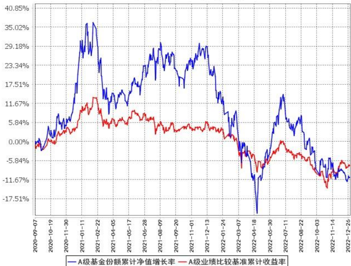
A级基金份额累计净值增长率与同期业绩比较基准收益率的历史走势对比图 (2020年9月7日至2022年12月31日)