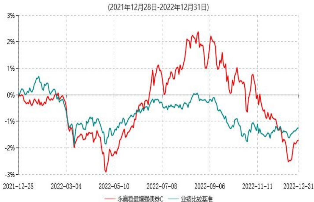
永赢稳健增强债券C累计净值增长率与业绩比较基准收益率历史走势对比图