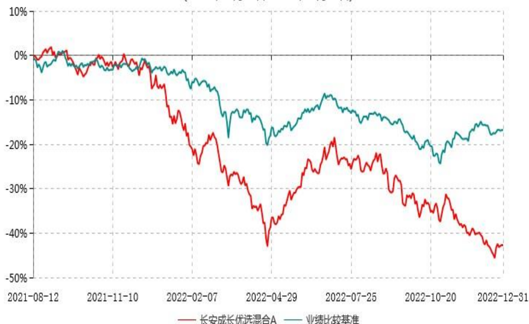
长安成长优选混合A累计净值增长率与业绩比较基准收益率历史走势对比图 (2021年08月12日-2022年12月31日)

根据基金合同的规定,自基金合同生效之日起6个月内基金各项资产配置比例需符合基金合同要求。本基金在建仓期结束后,各项资产配置比例已符合基金合同有关投资比例的约定。基金合同生效日至报告期末,本基金运作时间已满一年。图示日期为2021年08月12日至2022年12月31日。