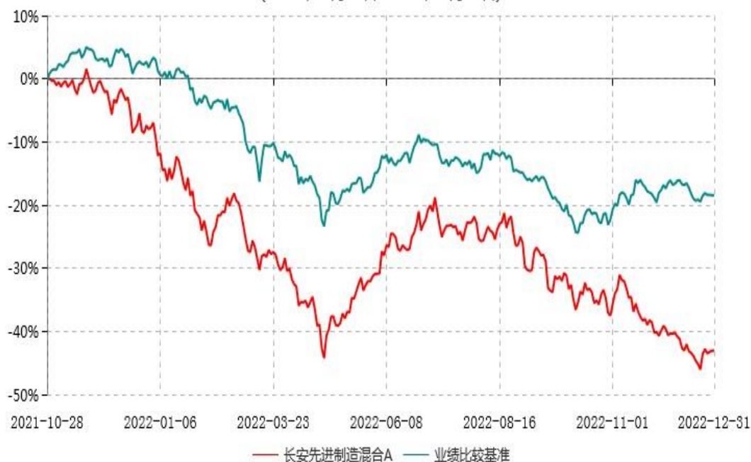
长安先进制造混合A累计净值增长率与业绩比较基准收益率历史走势对比图 (2021年10月28日-2022年12月31日)

根据基金合同的规定,自基金合同生效之日起 6 个月内基金各项资产配置比例需符合基金合同要求。本基金在建仓期结束后,各项资产配置比例已符合基金合同有关投资比例的约定。图示日期为 2021 年 10 月 28 日至 2022 年 12 月 31 日。