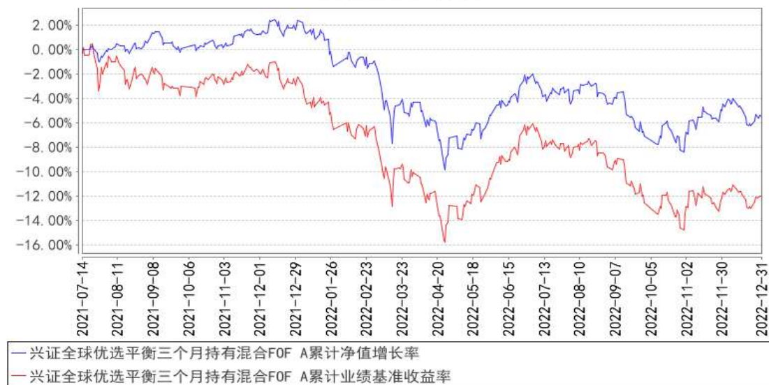
兴证全球优选平衡三个月持有混合FOF A累计净值增长率与同期业绩比较基准收益率的历史走势对比图