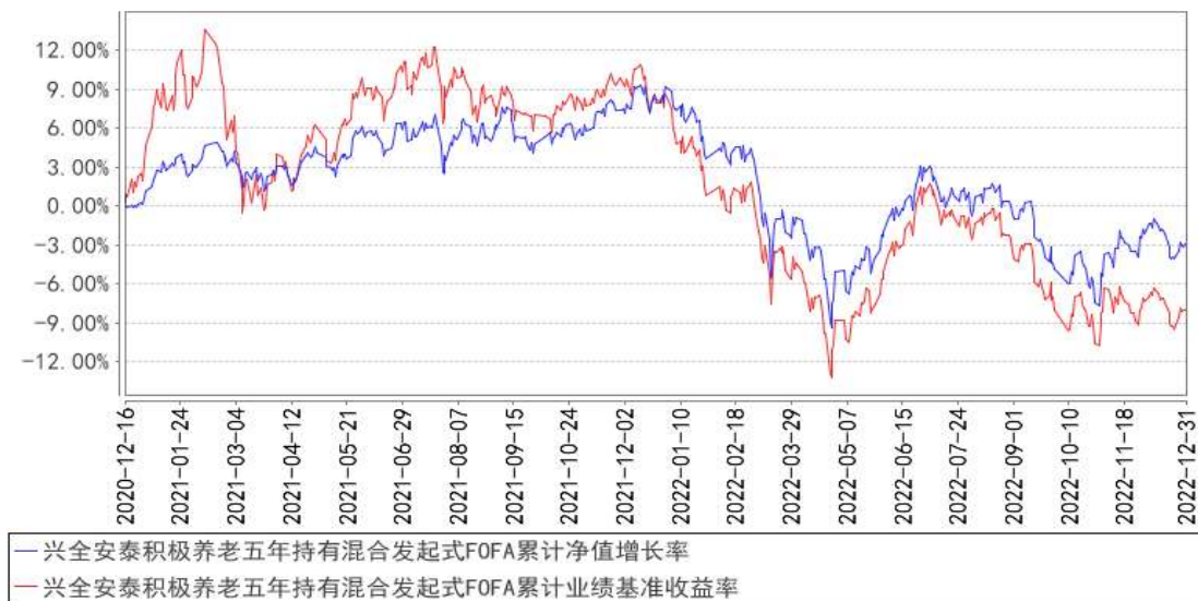
兴全安泰积极养老五年持有混合发起式FOFA累计净值增长率与同期业绩比较基准收益率的历史走势对比图