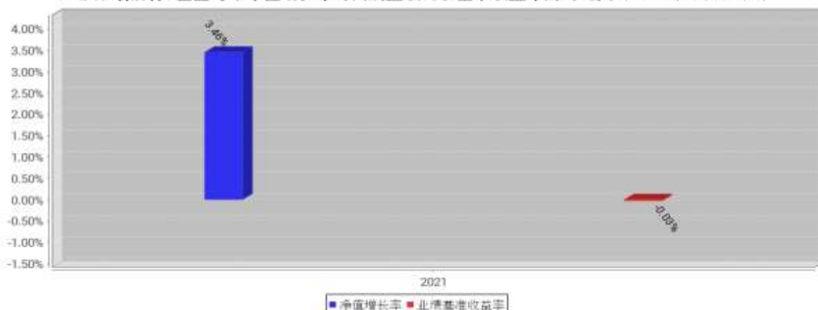
工银聚瑞混合A基金每年净值增长率与同期业绩比较基准收益率的对比图（2021年12月31日）

注：1、本基金基金合同于2021年5月28日生效。合同生效当年不满完整自然年度的，按实际期限计算净值增长率。