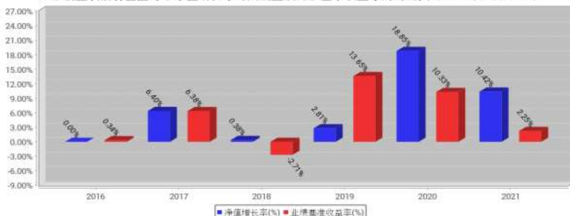
工银新生利混合基金每年净值增长率与同期业绩比较基准收益率的对比图（2021年12月31日）

注：1、本基金基金合同于2016年12月29日生效。合同生效当年不满完整自然年度的，按实际期限计算净值增长率。