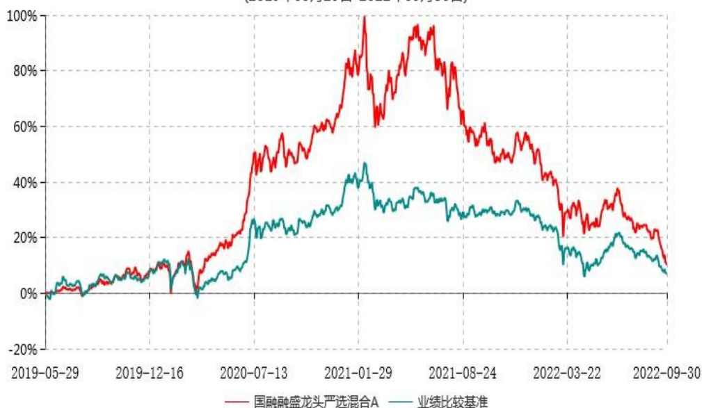
国融融盛龙头严选混合A累计净值增长率与业绩比较基准收益率历史走势对比图 (2019年05月29日-2022年09月30日)

2、自基金合同生效以来基金累计净值增长率变动及其与同期业绩比较基准收益率变动的比较