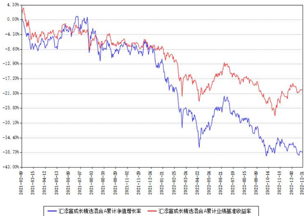
汇添富成长精选混合A累计净值增长率与同期业绩基准收益率对比图