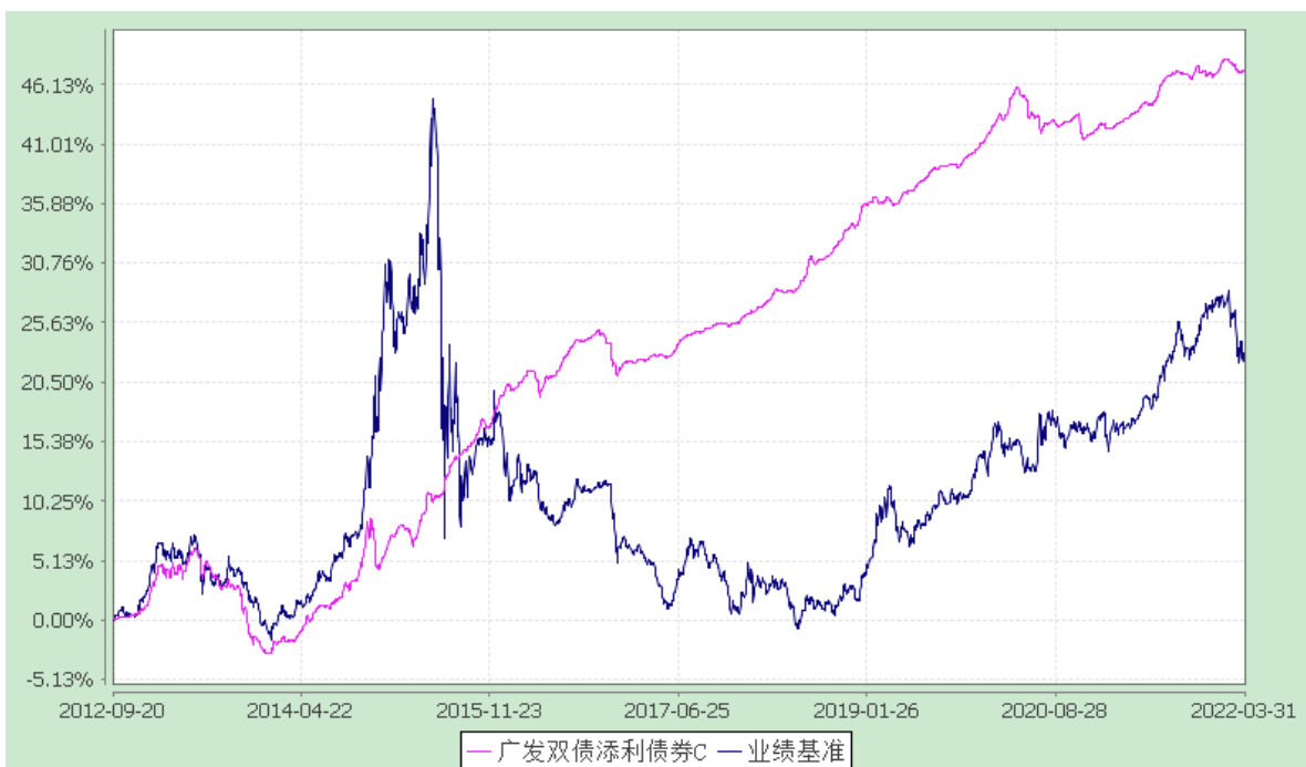
(3) 广发双债添利债券 E